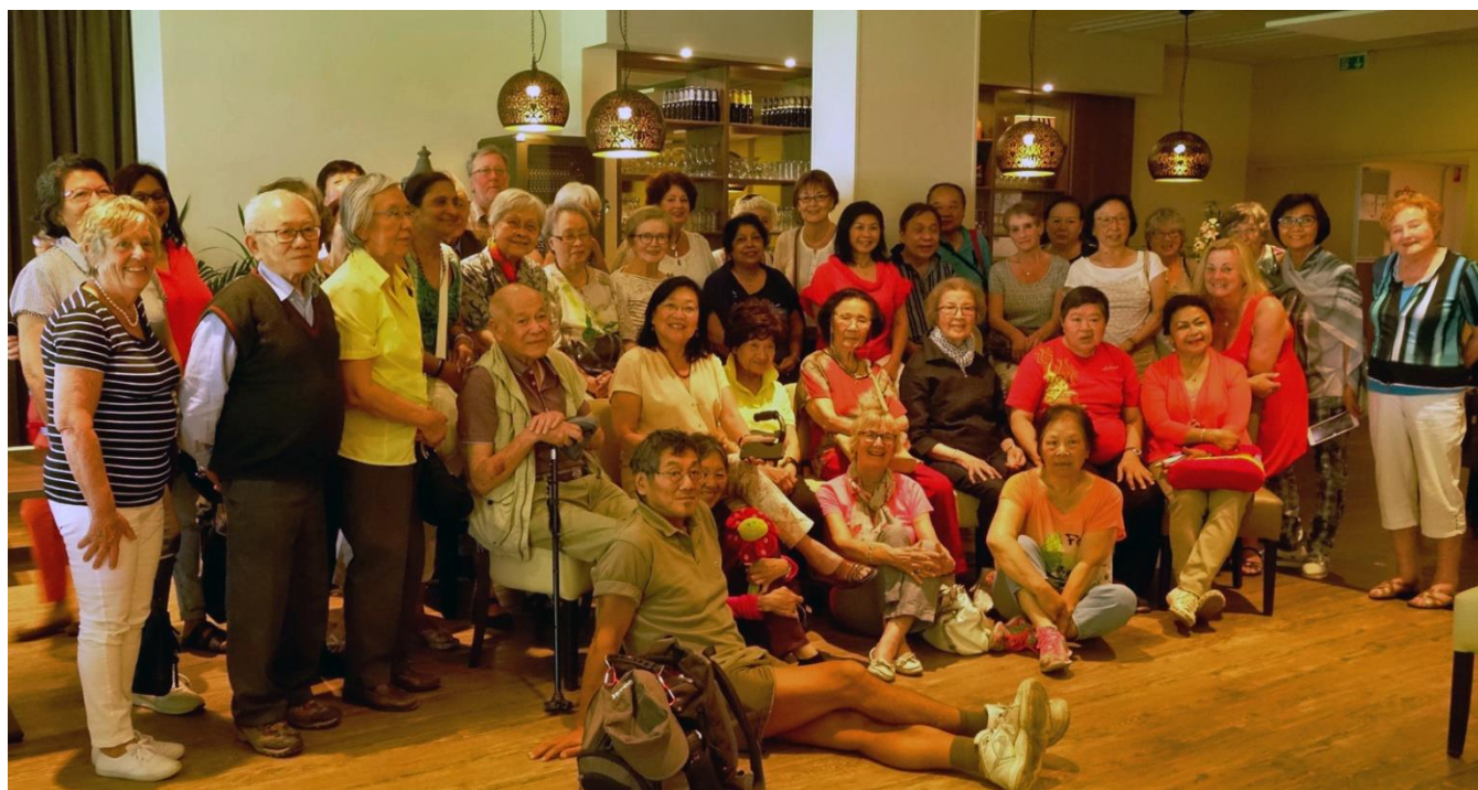
Foto uitstapje Giethoorn, 27 mei