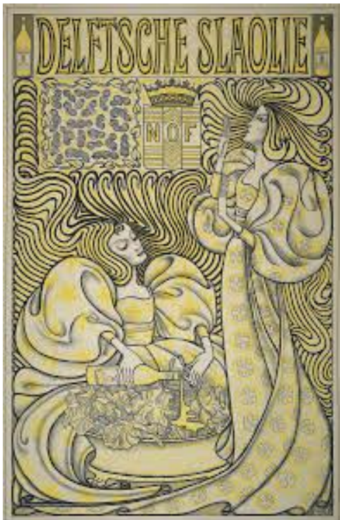
Jan Toorop, affiche, in opdracht van de Nederlandsche Oliefabrieken, 1894